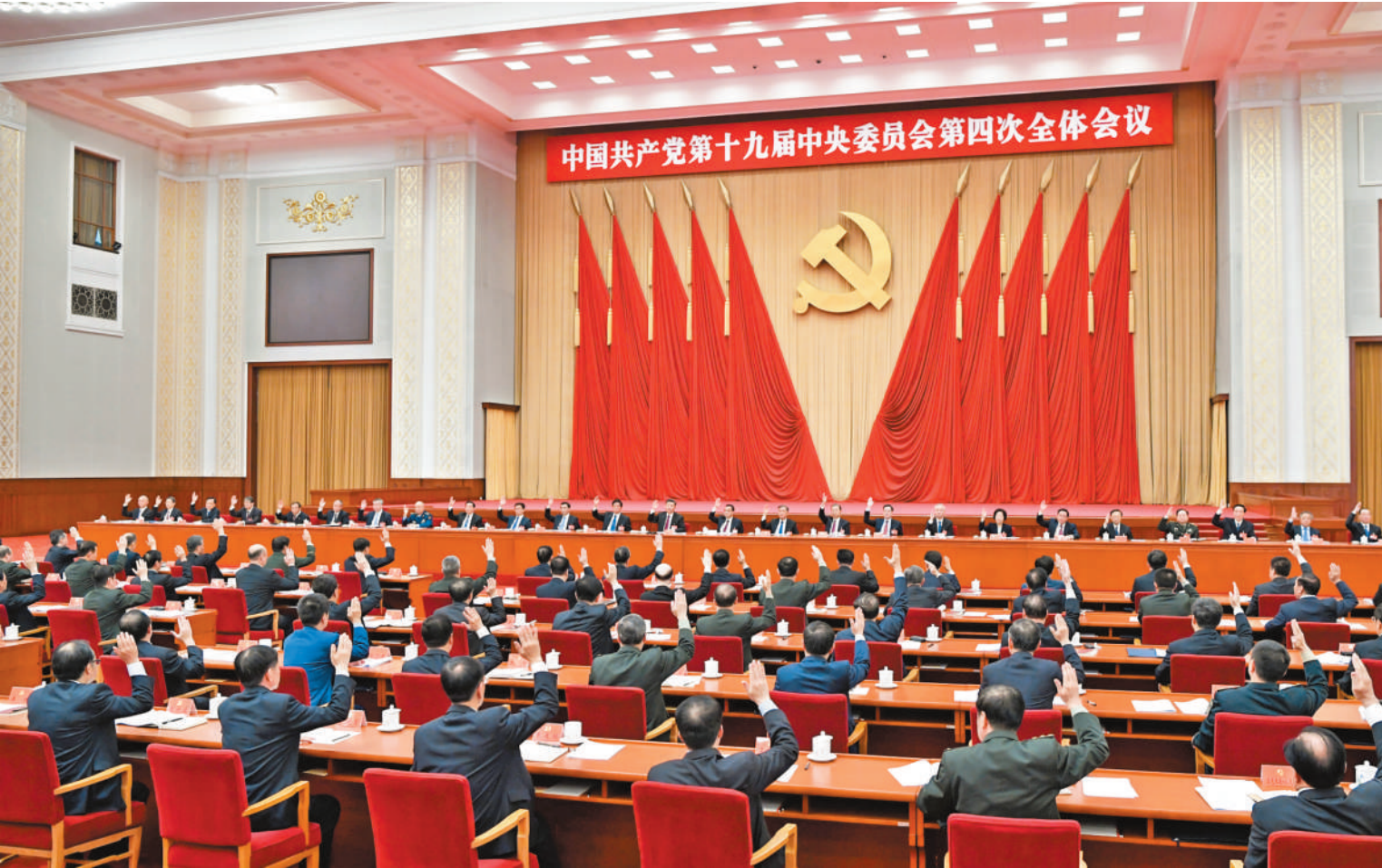
中国共产党第十九届中央委员会第四次全体会议,于2019年10月28日至31日在北京举行。中央政治局主持会议。

新华社北京 10 月 31 日电 中国共产党第十九届中央委员会第四次全体会议公报 (2019 年 10 月 31 日中国共产党第十九届中央委员会第四次全体会议通过) 中国共产党第十九届中央委员会第四次全体会议,于 2019 年 10 月 28 日至 31 日在北京举行。 出席这次全会的有,中央委员 202 人,候补中央委员 169 人。中央纪律检查委员会常务委员会委员和有关方面负责同志列席会议。党的十九大代表中的部分基层同志和专家学者也列席会议。 全会由中央政治局主持。中央委员会总书记习近平作了重要讲话。 全会听取和讨论了习近平受中央政治局委托作的工作报告,审议通过了《中共中央关于坚持和完善中国特色社会主义制度、推进国家治理体系和治理能力现代化若干重大问题的决定》。习近平就《决定(讨论稿)》向全会作了说明。 全会充分肯定党的十九届三中全会以来中央政治局的工作。一致认为,面对国内外风险挑战明显增多的复杂局面,中央政治局高举中国特色社会主义伟大旗帜,坚持以马克思列宁主义、毛泽东思想、邓小平理论、“三个代表”重要思想、科学发展观、习近平新时代中国特色社会主义思想为指导,全面贯彻党的十九大和十九届二中、三中全会精神,准确把握国内国际两个大局,着力抓好发展和安全两件大事,加强战略谋划,增强战略定力,坚持稳中求进工作总基调,继续统筹推进“五位一体”总体布局和协调推进“四个全面”战略布局,团结带领全党全国各族人民攻坚克难、砥砺前行,庆祝中华人民共和国成立 70 周年系列活动极大振奋和凝聚了党心军心民心,庆祝改革开放 40 周年系列活动增强了将改革进行到底的信心,“不忘初心、牢记使命”主题教育成效明显,深化党和国家机构改革各项工作胜利完成,改革开放全面深化,经济社会保持健康稳定发展,坚决打好三大攻坚战和应对各种风险挑战工作有力有效,国防和军队现代化深入推进,推动党和国家各项事业取得新的重大进展。 全会提出,中国特色社会主义制度是党和人民在长期实践探索中形成的科学制度体系,我国国家治理一切工作和活动都依照中国特色社会主义制度展开,我国国家治理体系和治理能力是中国特色社会主义制度及其执行能力的集中体现。 全会认为,中国共产党自成立以来,团结带领人民,坚持把马克思主义基本原理同中国具体实际相结合,赢得了中国革命胜利,并深刻总结国内外正反两方面经验,不断探索实践,不断改革创新,建立和完善社会主义制度,形成和发展党的领导和经济、政治、文化、社会、生态文明、军事、外事等各方